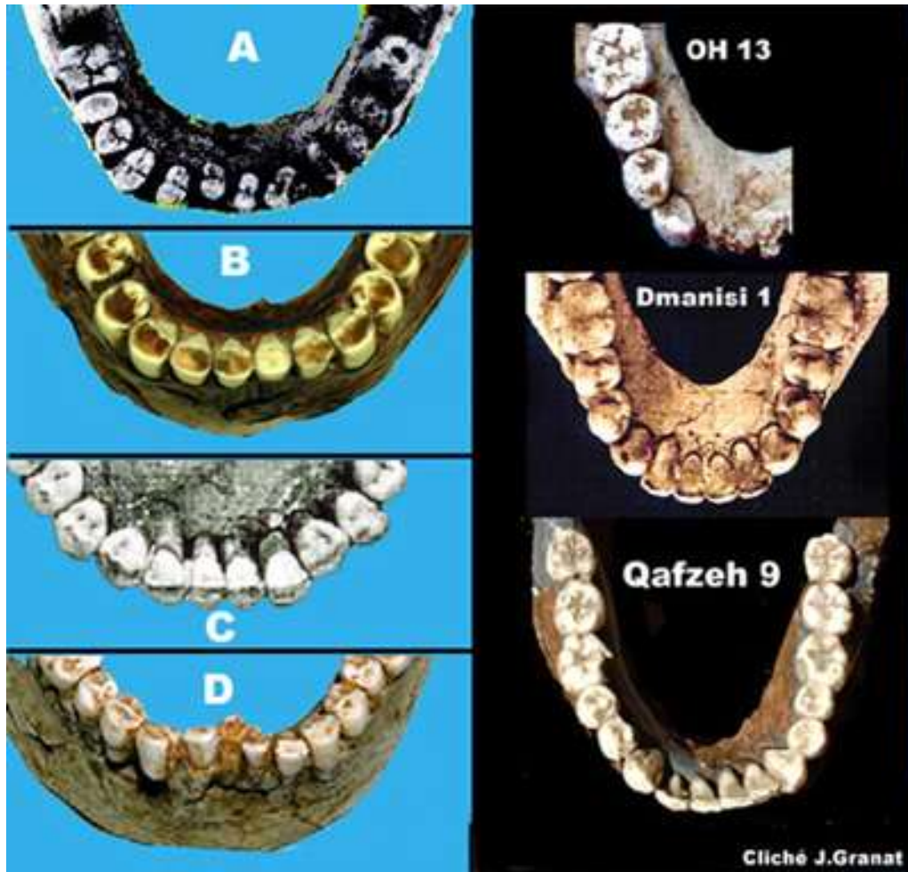
FIGURE2. — Usure des incisives et évolution. A gauche, mandibules néandertaliennes: A: La Ferrassie, B: Tabun, C: Regourdou, D: Amud. A droite, mandibules de la lignée 'moderne'

Incisive n.f.. Dérivé savant d' incision (1545, Paré, au pluriel), désigne chacune des dents de devant, aplatie et tranchante, qui sert à couper les aliments [A. REY – Le Robert Dictionnaire historique, 2000]