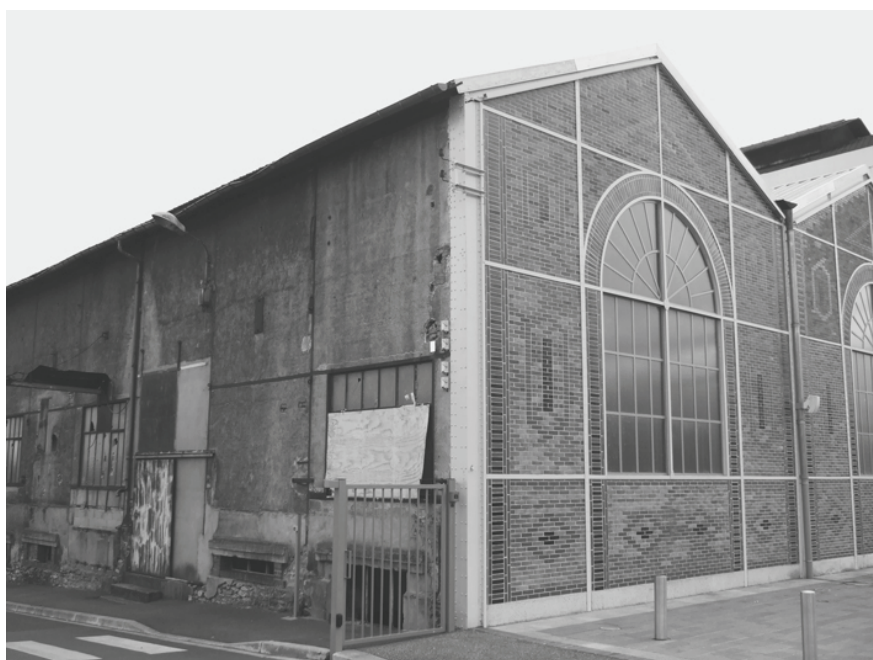
Illustration 3 : Jonction de la façade avec l'arrière du bâtiment B3