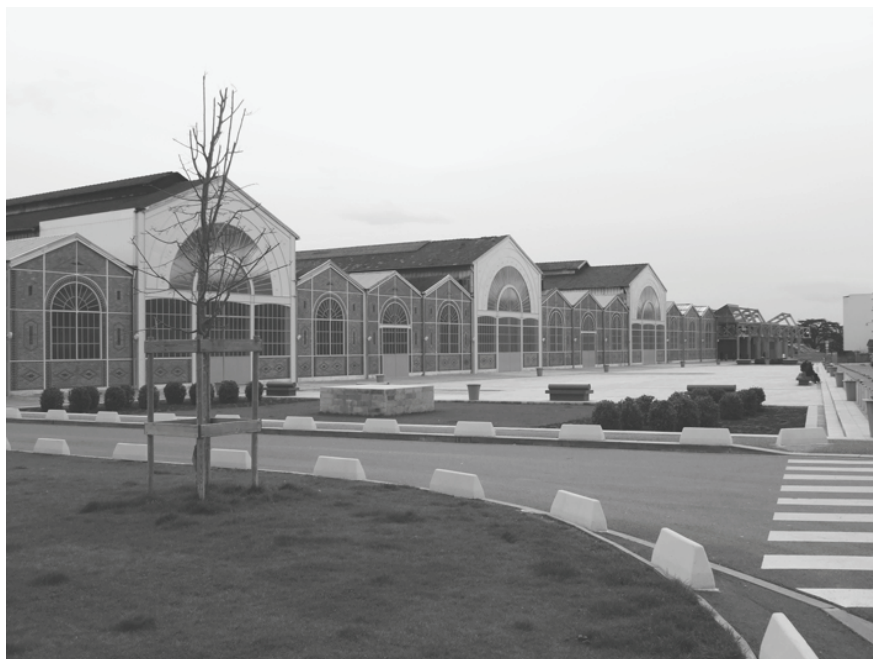
Illustration 2 : Façade du bâtiment B3

symbole. Vierzon a perdu son symbole. Il n'y a plus d'usine qui porte l'image de cette ville.