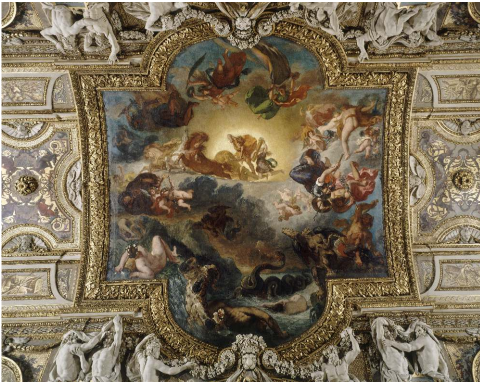
Apollon vainqueur du serpent Python. Plafond de la Galerie d'Apollon : compartiment central. Programme de Charles Le Brun en 1663-1674, resté inachevé. Exécuté lors de la restauration par Duban.

Figures des Heures en stuc Delacroix Eugène (1798-1863) Le Brun Charles (1619-1690) (d'après) Paris, musée du Louvre