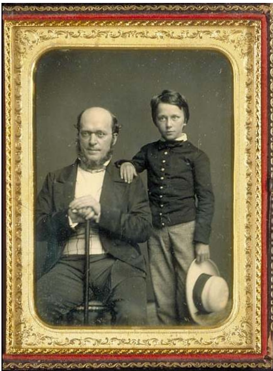
Henry James, Sr., and Henry James, daguerreotype par Mathew Brady (1854)