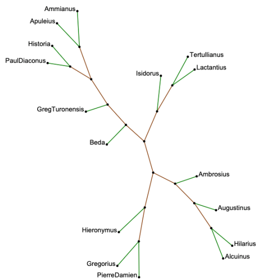
Figure 1 : calcul des distances Brunet