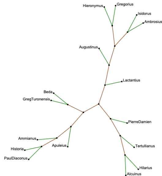
Figure 2 : calcul des distances Jaccard